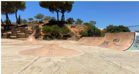
Skatepark del Parque Moret

(Hay posibilidad de cambio a otro spot, se avisaría el día antes de la sesión)